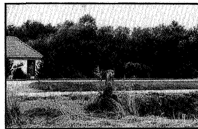
Stortplaats Zuidhorn bij huis De Kolk langs rijksweg Groningen-Leeuwarden

Vervolgens werden de volle vaten op een vrachtauto geplaatst en naar de stort gereden. Een hendel werd overgehaald en de vaten verdwenen in het stortgat.