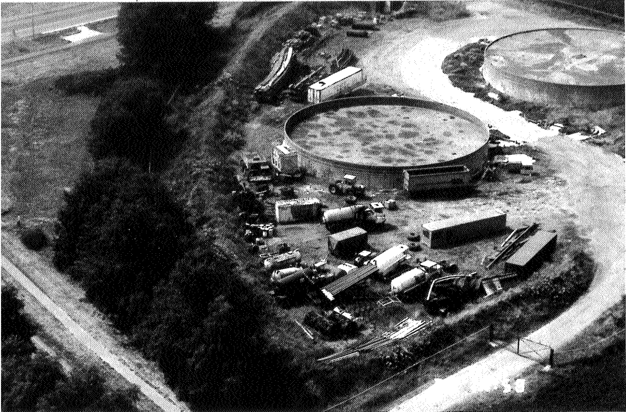
Illegale opslag autowrakken en andere voertuigen in de provincie Groningen. De mestbassins zijn niet afgedekt.