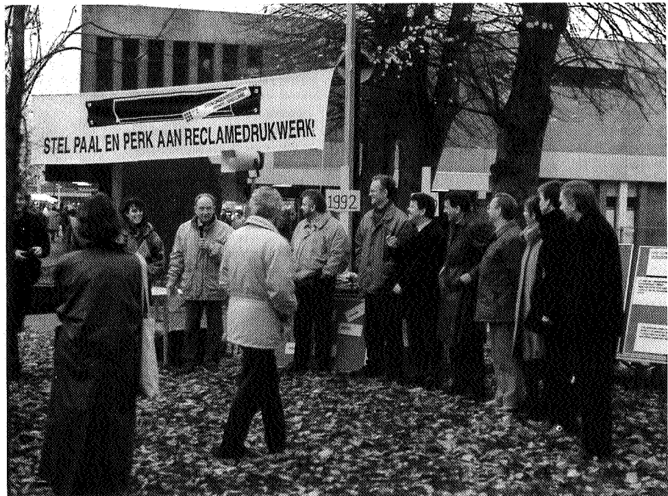
In 1992 start het ISV een actie tegen reclamedrukwerk

attente lezer zijn opgevallen dat de gemeenten aan het ISV geen bevoegdheden hebben overgedragen. Zowel vergunningverlening als controles blijven (vooralsnog) bij de negen gemeenten. In de praktijk blijkt dat op basis