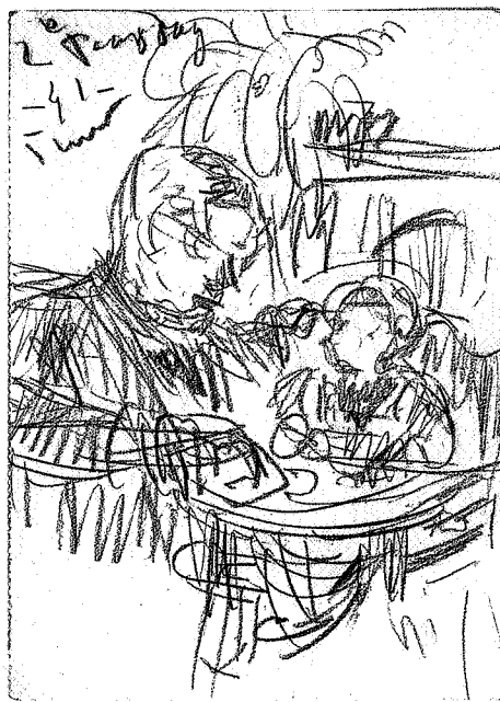
Nog één hapje..., potlood, 150 x 105 mm, 1941, annotatie: 2e Paasdag, - 41 - 5 uur; collectie Cees Hofsteenge