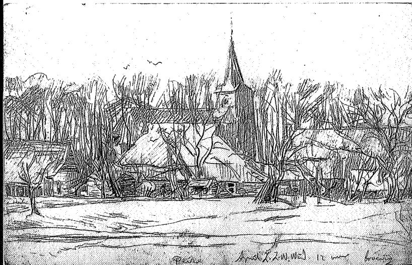
Peize, potlood, 110 x 170 mm, ca. 1910, annotatie: Peize, 's middags 12.00 uur, April, Z.Z.W.wind, broeiig; collectie Cees Hofsteenge

Jan Jaap Heij e.a. (red), F.H. Bach 1865-1956. Tentoonstellingscatalogus, Groningen 1981. Instituut voor Kunstgeschiedenis, RUG. Cees Hofsteenge, De Ploeg 1918-1941. De hoogtijdagen. Groningen 1993, pg.22-25. Bronnen: Archief Cees Hofsteenge