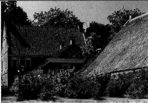
van links naar rechts: vooraanzicht van de borg Ploersema foto Omke Oudemans, Hamsterborg in de jaren zeventig foto Aerocamera, Zijaanzicht foto Omke Oudemans

noch altijd 'de Zaal' wordt genoemd en een eetkamer. De eerste verdieping bestaat uit meerdere vertrekken en nog een verdieping hoger bevindt zich een grote zolder met oude gebinten die nauwelijks te lijden hebben gehad onder de tand des tijds. Borg en boerderij zijn aan elkaar gebouwd door een tussenstuk. Het erf is groot en ruim en de tuin is aangelegd in klassieke stijl.