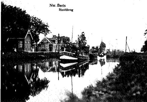
De Hoofdbrug in Nij Beets over het Polderhoofdkanaal

Bij erfgoedmanagement wordt niet, zoals bij conservatie, geredeneerd vanuit het te beschermen object, maar vanuit de vraag naar cultuurhistorisch erfgoed, zoals die leeft bij de consument. In het begin was erfgoedmanagement vooral een instrument van city-marketing, gericht op toeristen en ondernemers. Zowel toeristen als ondernemers die zich aan het oriënteren zijn op een nieuwe vestigingsplaats, blijken steeds vaker op zoek naar een interessante cultuurhistorische omgeving. Het renoveren, restaureren of herbouwen van