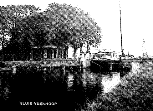
De sluis bij De Veenhoop