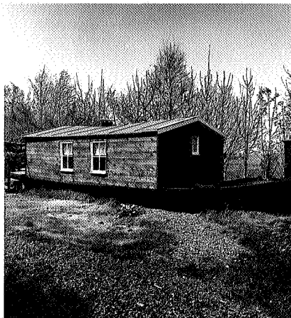
Armoedige bewoning van seizoenarbeiders in het veen, begin deze eeuw

het cultuurhistorisch erfgoed vergroot de aantrekkelijkheid van steden en genereert daarmee inkomsten voor de stad. Voorbeelden van actief erfgoedmanagement zijn te vinden in de Spaanse steden langs de Costa's. Een stad als Girona is succesvol geweest in het lokken van strandtoeristen die ook belangstelling hebben voor een 'dagje cultuur'. Om dat te bereiken heeft de Girona bewust zijn stadscentrum laten verfraaien.