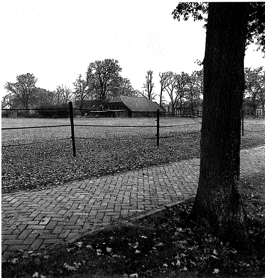
Hoe lang blijft Gieten nog aantrekkelijk, foto Harry Cock

In de lokale krant sijpelen de eerste berichten door van ongeruste inwoners. En terecht: wat staat hen te wachten? Het dorpse karakter van Gieten, mede bepaald door deze open groene ruimte, wordt ernstig aangetast. De verkeersdruk op de Asserstraat als aanvoerrote voor het centrum zal toenemen en gedurende de komende decennia zal het gemeentehuis aanleiding zijn tot uitbouw, aanbouw en opbouw voor gemeentelijke diensten, nieuwe ontwikkelingen en faciliterende bedrijven. Zo ondergaat Gieten de 'verharing' en kunnen we ook dit dorp binnenkort afschrijven als aantrekkelijk esdorp. ☹