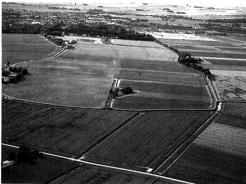
De Moeshorn ten zuiden van Uithuizen met de Menkemaborg op de achtergrond