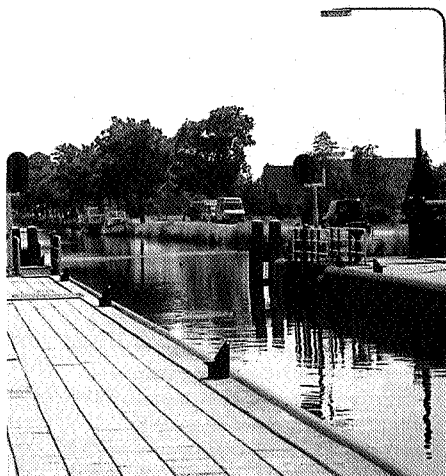
Het blauwe waterwerk bij de sluis in Erica, foto's Ansje Monkhost

heggetjes, die niet te hoog mogen en een rijtje nieuwe lindebomen. 'Ik kwam dan ook al vrij snel tot de overtuiging, dat het sluisgebouw eigenlijk het enige rustpunt op deze plek is. Daar moest ook de relatie met mijn werk liggen. Massa tegenover massa. Bovendien wilde ik niet de indruk wekken dat er weer kunst stond. Het moest lijken alsof het ook een functie zou kunnen hebben. Ik noem het dan ook liever geen beeld maar een bouwwerk, net als het geconstrueerde systeem van een sluis met een gemaal voor mij iets in zich geeft van een bouwwerk.'