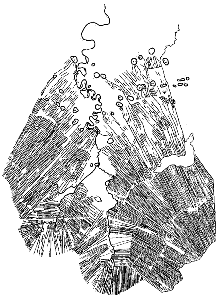
Kaart 2 Het verkavelingspatroon op de oevers van de Fivel. Het patroon vindt zijn oorsprong in de wierdenreeksen.

landschap, maar net voldoende om de grote witte boerderijen bij warm weer trillend in de lucht te laten hangen. Deze vergezichten zijn niet zonder betekenis. Eens markeerden ze de eigendomsgrenzen van de Schildwolder boeren; verre grenzen, die ze in dit open landschap vanuit hun boerderijen konden zien. Dat moet deze boeren een speciaal gevoel hebben gegeven.