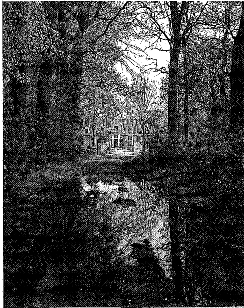
De havezate de Klencke