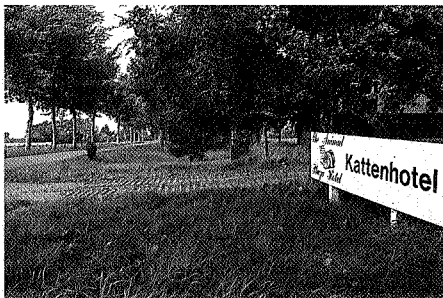
The Animal Plaza Hotel in downtown Boermaastreek, foto Rob de Groot

deres over de Hondsrug. 'Je voelt dat je op het dak van een landschap rijdt.'