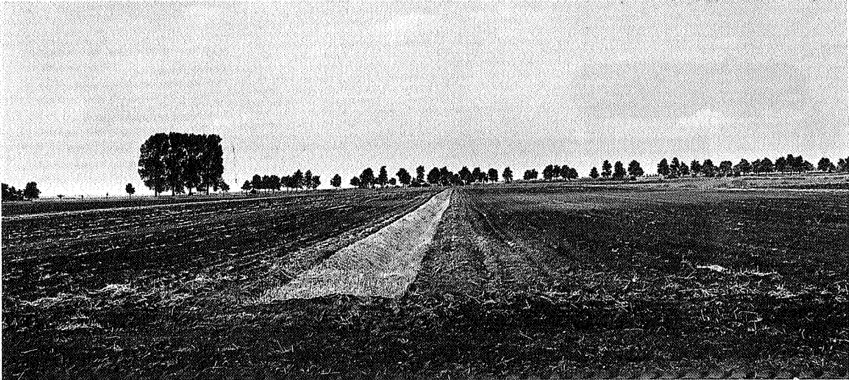
De Hunzevlakte is de grootste aardappelakker van Noordoost-Nederland, foto Rob de Groot

Er is een weerstand om voortdurend nieuw beleid te maken. Het Drentse Landschap heeft contact gezocht met Wereld Natuur Fonds omdat die nieuwe natuur in Nederland wil realiseren en dat kan hier uitstekend. Samen met de waterleidingbedrijven van Groningen en Drenthe en het bedrijfsleven wil Het Drentse Landschap met een totaal visie op de leefbaarheid van het Hunzedal komen.