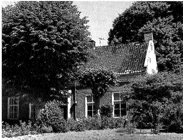
Het vroegere huis dat in 1989 door brand verwoest is

Bonte is niet weinig trots op het energiezuinige verwarmingssysteem dat hij bedacht heeft. 'Het huis is namelijk om een bijzondere kachel gebouwd. Het lijkt wel een open haard. Het bijzondere aan de kachel is dat je als je 's morgens de kachel stookt hij gedurende 24 uur warmte blijft uitstralen. Je stookt op hout. De warmte wordt opgeslagen in een bijzondere soort steen die de warmte lang vast houdt. Op alle verdiepingen bevinden zich deze zogenaamde warmtemuren, die je centraal beneden kunt bedienen. Het