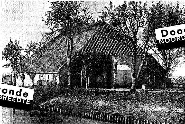
Van de boerderij staat momenteel alleen nog de schuur

Reenders: 'Ik heb ergens 20.000 stenen in depot staan die nog ouder zijn dan de steen waaruit dit huidige gebouw is opgetrokken. Ook de antieke blauwe dakpannen staan klaar...alles geheel in stijl en van oude materialen. En trouwens wat er stond was evenmin origineel, het nieuwe bouwwerk is mooier en interessanter dan het oude'. En terwijl een oud kop-hals-romp boerderijtje op Toornwerd geheel en al ingestort is (zie Doodzonde 1992 - 5) en alleen door herbouw gered kan worden, moet 400 meter verderop een oud