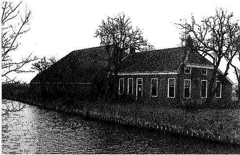
Dude situatie van het inmiddels afgebroken molenhuis