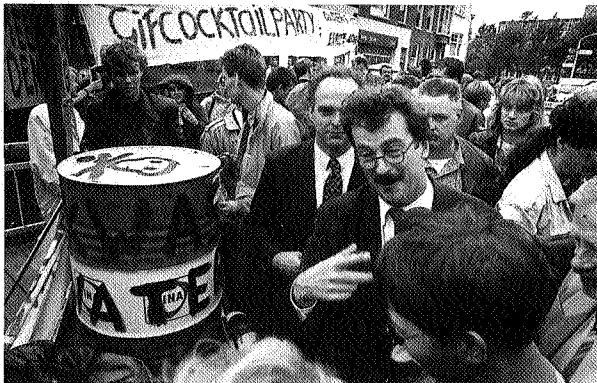
Tijdens de start van de grootste bodemsanering in Noord-Nederland wordt Minister Alders aangesproken door actievoerders.