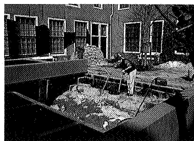
Boven: Het begin van de route: een wak in het ijs Onder: Aanleg van de boerensloot met links de waterserre

half onder water staan. Een speciale preparateur heeft maanden gewerkt aan de fraaie vismodellen. Ook de waterplanten zijn voor een groot deel zelf gemaakt. Het meest spectaculaire gedeelte is de nieuwe gegraven kelder in de binnenruimte van het museum. Daar is een boerensloot nagebouwd. Buiten kun je om de sloot lopen, die begroeid is oeverplanten en bewoond wordt door stekelbaarsjes en kikkers. Van binnen uit kun je hier ook naar kijken. Je loopt dan via twee sluisdeuren een ruimte binnen - een glazen serre. De bezoeker kijkt dan tegen een glazen wand aan in de sloot, dat is dus een soort aquarium effect. Maar extra leuk is dat de glazen wand ook boven je hoofd doorloopt zodat je de vissen en kikkers van onderaf kunt zien zwemmen. Dit aardigste onderdeel vormt een onderdeel van een wandeling door het onderwaterlandschap, aldus een enthousiaste Harry Wijnandts.