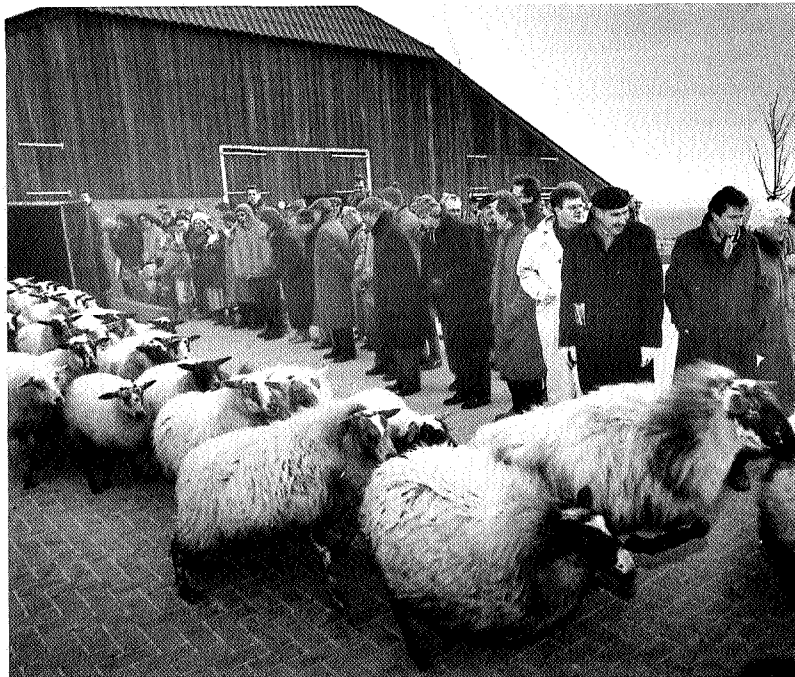
Schape stormen de hei op