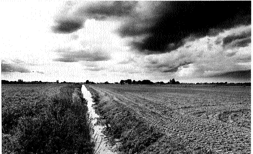
Veenkoloniën bij Kiel-Windeweer