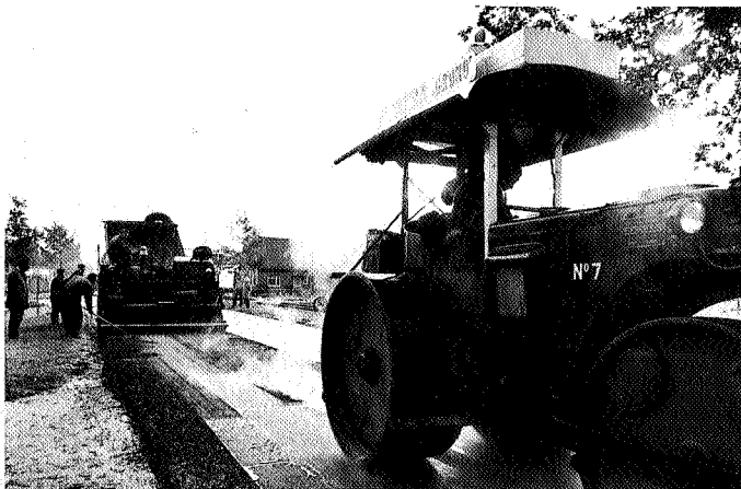
Autogebruik terugdringen ook in Drente

hoogste scoort in Nederland. Dit om te buigen vergt een grote krachtsinspanning. Maar willen wij het autogebruik terugdringen, dan dient er een alternatief te zijn; een beter openbaar vervoer. Dat ook dat geld gaat kosten is wel duidelijk. Uiteindelijk zal ook de provincie niet ontkomen aan het beschikbaar stellen van gelden. Prioriteit ligt bij het rijk, maar wel beseft moet worden, dat één gulden naar het openbaar vervoer ook maar één keer kan worden uitgegeven.