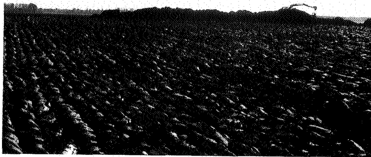
Graafmachine moet eerst een laag vette klei verwijderen om bij de resten van het kerkhof te komen

sche en Cultuurhistorische terreinen in de Provincie Groningen van de PPD Groningen (1985) als terrein van archeologische betekenis. Dit rapport fungeert als archeologische meldingskaart voor de provincie Groningen. Daarmee werd van officiële zijde de aandacht op het 'Ol Kerkhof' gevestigd. Ook de gemeente Scheemda besteedde in haar bestemmingsplan Buitengebieden aandacht aan dit stukje van haar 'bodemarchief' en gaf het in de toelichting en op de plankaart van het bestemmingsplan een aanduiding als archeologische vindplaats en een voorlopige bestemming mee. Op dat moment (1986) was al duidelijk, dat de toekomstige Rijksweg 7 het 'Ol Kerkhof' niet ongemoeid zou laten. Men had zich op het standpunt gesteld, dat het Biologisch-Archaeologisch Instituut de gelegenheid moest krijgen ter plaatse onderzoek te doen. Met andere woorden: wetenschappelijk onderzoek werd van belang geacht, maar de resten van het 'Ol Kerkhof' zouden wel door de wegaanleg moeten verdwijnen. Het werd dus wijken voor de weg.