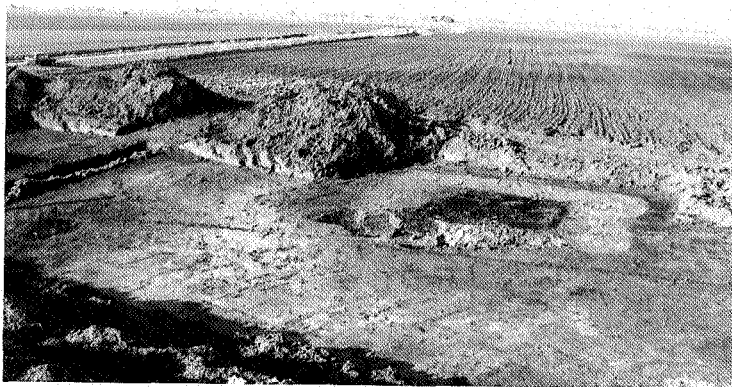
Een deel van het opgravingsvlak met rechts van het midden sporen van het torenfundament. Links een deel kerkhofmuur; geheel links de Pastorieweg naar Nieuw Scheemda op de achtergrond

Daarnaast heerste de opvatting, dat de aanwezigheid van het oude Scheemda geen op zichzelf staand verschijnsel is. Het vormt eerder onderdeel van een systematische historische ontwikkeling, een ontwikkeling die in het middeleeuwse veenlandschap ook elders plaatsgreep en wel op grond van onoordeelkundig bodemgebruik. Men ontwaterde, het veen klonk sterk in en het probleem van wateroverlast was een feit. Wat dat betreft past Scheemda geheel in een rijtje van Oost-Groninger dorpen aan de rand van het Dollardinbraakgebied. Van sommige dorpen is bekend, dat resten van hun verdwenen voorganger nog onder de klei liggen. In de naaste omgeving van Scheemda bezitten dorpen als Meeden en Midwolda een terrein met een naam als 'Ol Kerkhof' of 'Ol Kerke', beide in de Dollardklei gelegen buiten het huidige dorp.