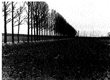
Strakke lijnen in de Johannes Kerkhovenvolder

Incidenteel is er zeker plaats voor. Voor hun produkten moeten ze wel behoorlijk hogere prijzen vragen. En als een deel van de mensen dat wil betalen dan loopt zo iets wel. Maar wil en kan de hele bevolking zoveel meer gaan betalen voor landbouwprodukten? Veel meer uitbreiding in de b-d sfeer zie ik niet gebeuren. Van al mijn kollega's weet ik dat er weinig animo bestaat om op b-d grondslag te