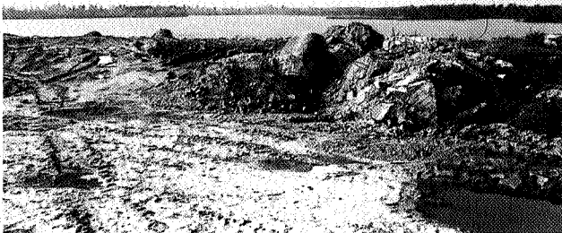
De rand van de stort, op de achtergrond de Piccardthof-plas.