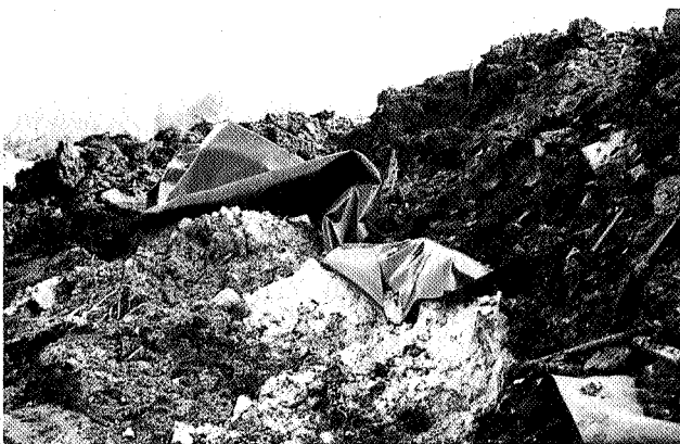
Bedeekt door een folie heeft de gemeente de zwaar verontreinigde grond boven op de stortplaats neergelegd.

doende een uitbreiding van de wijk Corpus den Hoorn te realiseren, zowel ten westen als ten oosten van de Veenweg. De bouw-kavels van het westelijk deel grenzen aan de Bouwman stort en de Piccardthof-plas. Hier kan de particulier een kavel grond kopen voor gemiddeld 1,5 ton, waarna diezelfde particulier hier nog een huis op moet zetten.