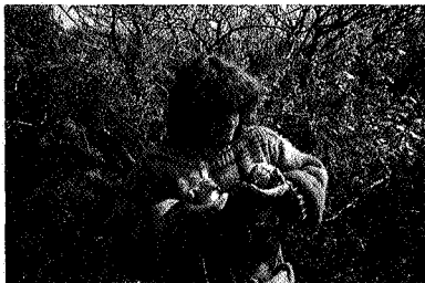
De auteur met de eerste 2 jonge zilvermeeuwen van 1987

Als vogelwachter op een onbewoond eiland heb je, het mag vreemd klinken, toch regelmatig met verschillende groepen mensen te maken. Daar zijn bijvoorbeeld de toeristen. Omdat '86 zo'n bijzonder mooie en '87 zo'n buitengewoon onbestendige zomer had, zijn vrijwel al de ontmoetingen met toeristen in het eerste jaar van het verblijf geweest. Vaak zijn het ondernemende mensen, die per kano of zeiljacht op weg naar Denemarken of juist naar Texel Rottumerplaat aandoen. Meestal zijn ze zich bewust van het feit dat dat niet de bedoeling is, maar kwam het hen vanwege het tij, het weer of de tijd van de dag beter uit om af te meren. Ze beloven dicht bij de boot te