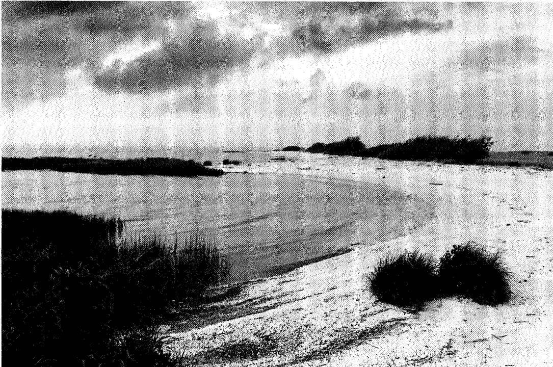
Schelpenbank Makkumer Noordwaard.

De komende jaren zal in Friesland een aantal activiteiten rond het thema 'Friesland leren kennen' plaatsvinden.