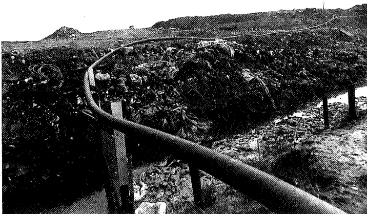
Afvoerpijp en greppel langs de vuilstort

Intussen rijden op de stortplaats de vrachtwagens nog steeds af en aan. Het zal nog wel even blijven stinken in Ouwsterhaule. ●