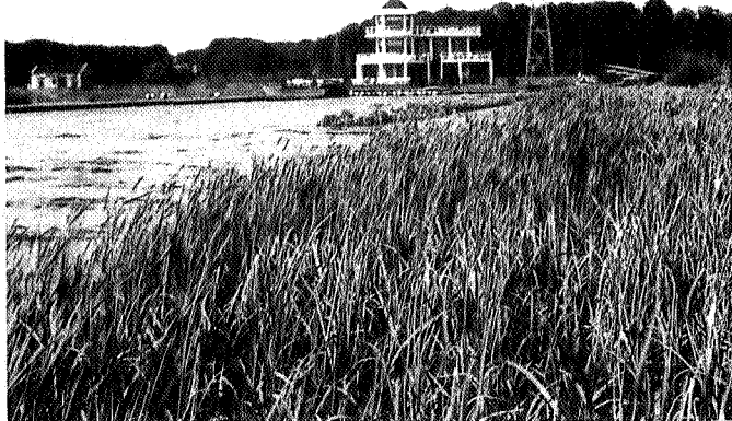
De Bloemert in 1935.