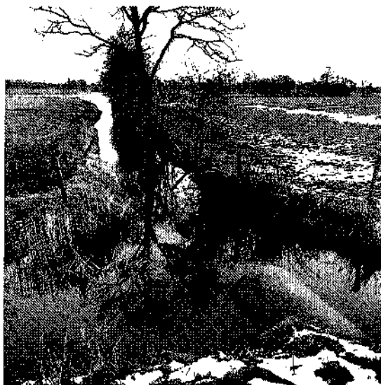
Zwadde in oostelijke richting na de Lauwersmeerzwaag