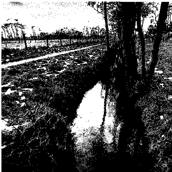
Fietspad ten zuiden van Kalkumerzwaag langs de Zwadde