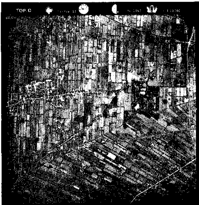
De Zwadde vormt duidelijk de grens tussen de noord-zuid ver kavelling en de noordwest-zuidoost ver kavelling. Links ligt Kollumerzeagag

Wie het vorig jaar door Noorderbreedte uitgegeven boek 'Rivieren van Noord-Nederland' kent, zal daarin vergeefs zoeken naar de Zwadde. Een water dat er wél in voorkomt, is de Zwette, geen rivier maar een kanaal. De klankovereenkomst tussen beide namen is treffend — ze betekenen dan ook hetzelfde. Zwadde of Swadde en Zwette of Swette staan voor 'grenswater'. De Zwette, het vaarwater tussen Leeuwarden en Sneek, vormde ooit de scheiding tussen Oostergo en Westergo en vervangt als grens en als vaarwater de vroegere Middelsee. De Zwadde, het watertje dat in dit artikel centraal staat, mag dan minder robuust zijn als de Zwette, maar vormt niettemin óók een grens. Enerzijds scheidt het de gemeenten Tietjerksteradeel en Dantumadeel, anderzijds Kollumerland en Achtkarspelen. Of de Zwadde een riviertje is, lijkt echter twijfelachtig. Wel zeker is, dat de Zwadde een historisch bepaalde waterloop is door het fraaie houtwallenlandschap van de Friese Wouden. Helaas dreigt een tweetal op handen zijnde ruilverkavelingen het authentieke karakter van de Zwadde ernstig aan te tasten.