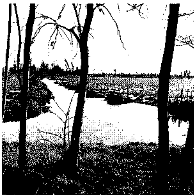
De Zwadde kruist de Zwaddesloot (links)