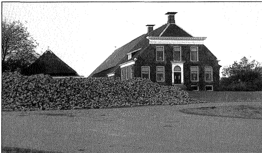
Suikerbieten bij Usquert

krachtvoer, energie en grondstoffen behoeft actieve ondersteuning. Dit geldt ook voor het prijsbeleid; globale subsidiëring (garantieprijs) leidt in het algemeen tot productieverhoging met alle negatieve gevolgen. Er is juist behoefte aan gerichte subsidiëring met inachtneming van eerder genoemde randvoorwaarden. Zo wordt het mogelijk om bv. investeringssteun te verstrekken aan bedrijven tot een bepaalde productieomvang (bv. middenbedrijven) en/of bedrijven die de productie mede richten op het behoud van natuur en landschap. Investeringspremies zoals die bijvoorbeeld op de bouw van ligboxenstallen worden gegeven dienen beschikbaar te komen voor bv. biogasininstallaties of houtverbrandingsinstallaties. Wellicht wordt hierdoor tevens extra werkgelegenheid (landschapsonderhoud binnen de bedrijfsvoering) geschapen. Zou het op toeval berusten dat bijvoorbeeld in