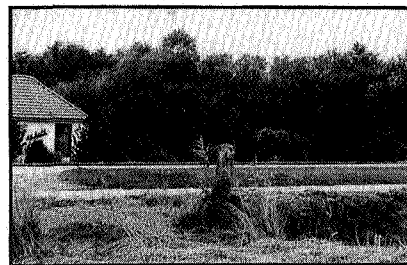
Stortplaats Zuidhorn bij huis De Kolk langs rijksweg Groningen-Leeuwarden

Vervolgens werden de volle vaten op een vrachtauto geplaatst en naar de stort gereden. Een hendel werd overgehaald en de vaten verdwenen in het stortgat.