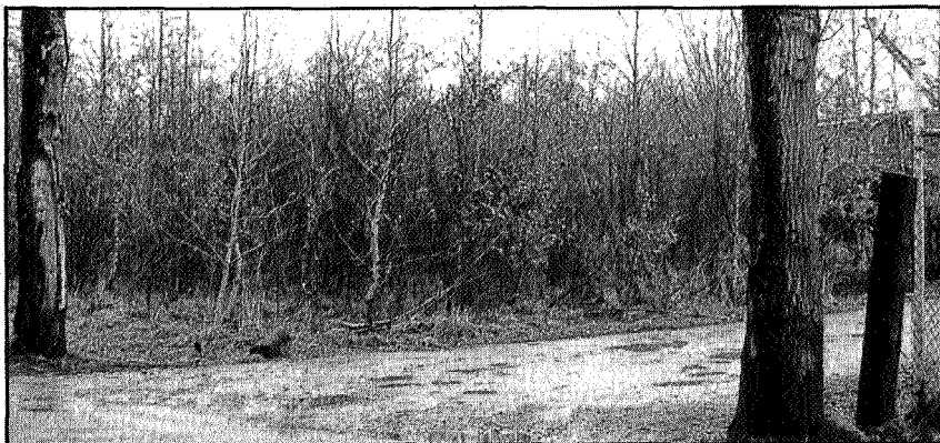
Stortplaats Nieuw Roden

Allereerst was de stortbelt van Hoogkerk aan het Aduarderdiep aan de beurt. Het kanaal zelf werd over een grote lengte van enkele kilometers zowel door Smid en Hollander als door de Suikerfabriek van CSM gedempt. Dit voorjaar nog dempte de CSM ook nog een grote sloot in Den Horn waar men enkele dagen mee bezig is geweest.