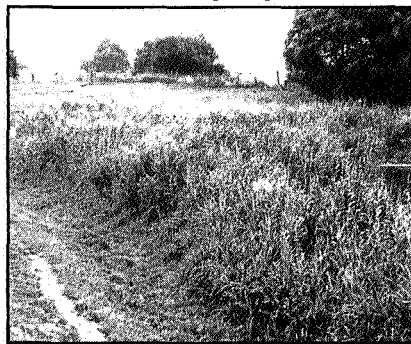
Stortplaats Aduardsterweg Hoogkerk

Een goudmijn ging er voor Smid en Hollander