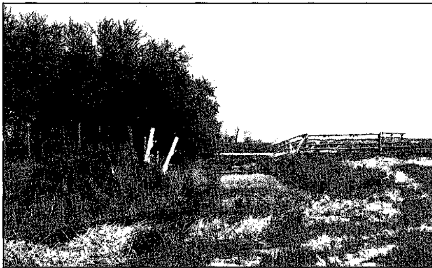
Het Maarvliet nabij de Wilkemaweg.

Het Maarvliet had zijn oorsprong in de venen van Engelbert. De bovenloop werd gevormd door de tegenwoordige Borgsloot, het