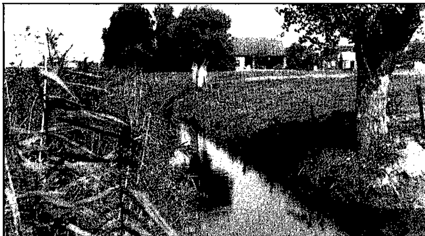
Een stukje rechte loop van het Maarvliet bij Garsthuizen