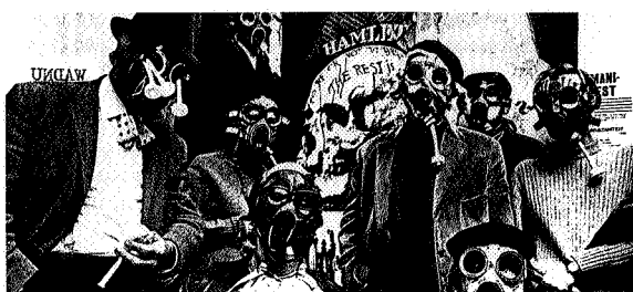
Kunstgroep Nu tijdens de opening van de tentoonstelling Wad Nu