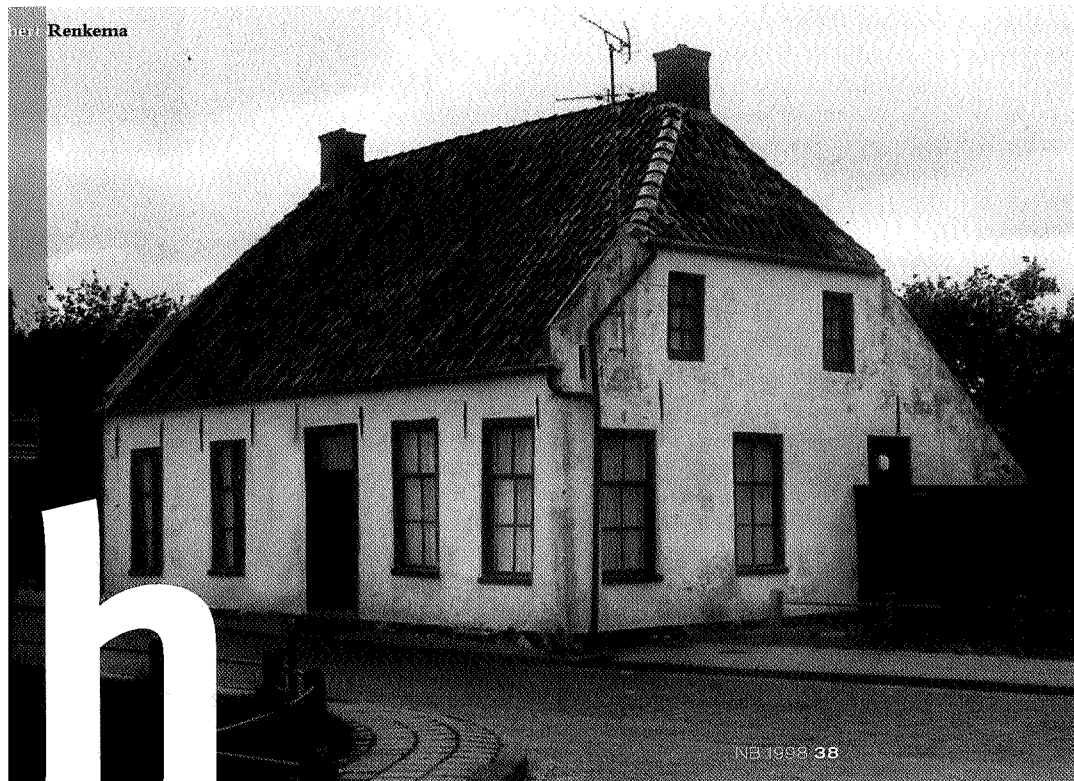
Het vroegere sluismeestershuis

Een bijzonder landschapselement bij Houwerzijl is Ol Weem, een wierde van de tweede generatie, die dateert uit