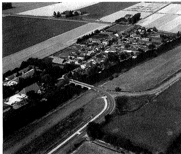
Lauwerzijl

Via Warfstermolen rijden we naar Munnekezijl. Links zien we in de verte de oude dijk van de Lauwerszee, die tot 1969 een echte zeedijk was. Munnekezijl heeft tot in de vorige eeuw aan de Lauwerszee gelegen. Dit verklaart de aanwezigheid van de grote kunstwerken. Rond 1575, in de Spaanse tijd, heeft Caspar de Robles opdracht gegeven de uitwateringsluuis te beschermen en daarom werd er een schans gebouwd. Het eiland tussen de twee takken van de Lauwers is het restant van deze schans. Ten noorden van Munnekezijl zien we dat de Lauwers rechtgetrokken is. Het