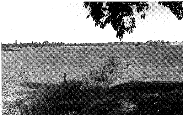
De Lauwers bij Stroobos

Peebosch toen echt bestond. Nu rest slechts de naam van het buurtschap. We rijden door naar Doezum, gelegen op de uitgestrekte zandrug van Grootegast. Als we de kerk bekeken hebben, rijden we over de Eezerweg naar het noorden en bedenken dat de naam Oosterweg betrekking heeft op de