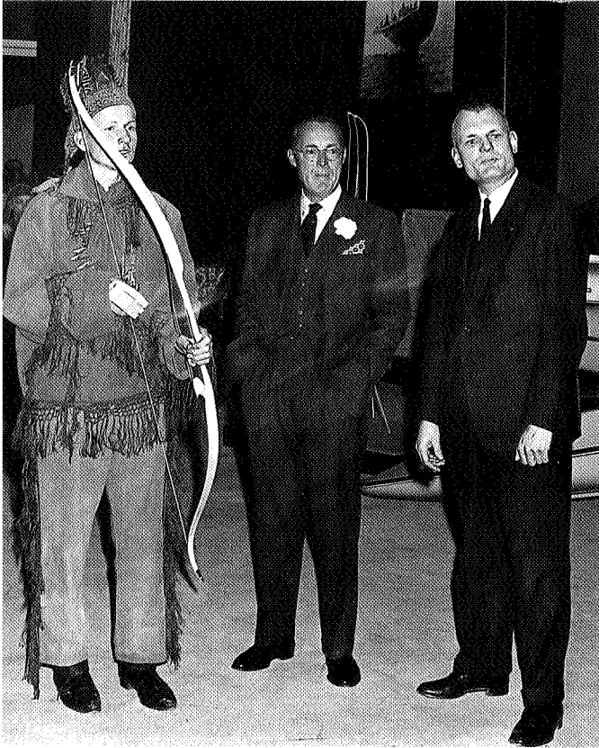
Prins Bernhard opent in 1963 de Silenka fabriek