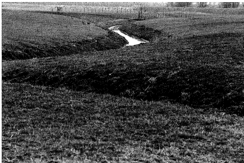
Meander van de Hunze

In het verleden werden de meeste goederen en perso- nen per schip vervoerd. Er kwam aan het einde van de 18e eeuw behoefte aan beter vervoer en overall ontston- den spoorlijnen. Zo werden er in de Woldstreek veel pogingen ondernomen om een spoorlijn aan te leggen. In 1913 kwam er echt schot in. Het Comité van Actie voor de Woldjerspoorweg werd opgericht. In 1914 werd de concessie aangevraagd voor een spoorlijn van