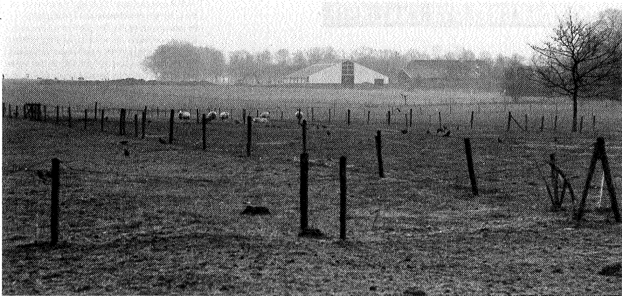
Het witte gevaarte op de Hondsrug bij Gieten

plan geeft immers de mogelijkheid. De enige uitweg vormen de vrijstellingsmogelijkheden: bij de beoordeling van de aanvraag moet B & W rekening houden met de ruimtelijke structuur en met de omwonenden. Juist in de vrijstellingsmogelijkheden was een goede uitweg gelegen om de aanvraag te weigeren, kennelijk wilde het College dat niet. Natuurlijk was de loods landschappelijk niet verantwoord en met de omwonenden is ook al geen rekening gehouden. De laatsten procederen daarom tot aan de Hoge Raad omdat zij vinden dat met hen juist geen rekening is gehouden.