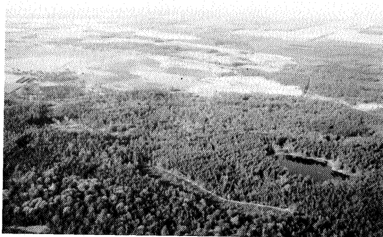
Berkenheuvel met rechts het Adderveen, op de achtergrond Wapserveld met Meeuwenpluis

Ten noorden van de Doldersummerweg van Diever naar Doldersum ligt Berkenheuvel, een bebost heide- en stuifzandgebied van zo'n 750 ha dat in 1969 voor het grootste deel in het bezit kwam van Natuurmonumenten. Een terreinverkenning met Roelof Schuiling.