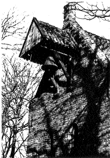
Klokkestoel van het kerkje van Janum

dranken te doen nuttigen. Dat lukte. De goede man was niet bestand tegen alcohol, werd misselijk en moest braken. Daar schaamde hij zich bijzonder voor, dus probeerde hij zo onopvallend mogelijk het in de mouw van zijn pij te doen. Maar de monniken hielden hem zorgvuldig in de gaten en triomfantelijk eisten zij dat de abt de inhoud van zijn mouw zou tonen om daarmee aan te geven dat hij door drankgebruik hun gelijke in het kwade was geworden. Toen na veel aandringen de abt zijn mouw opende, bleek deze gevuld te zijn met . . . rozen. De monniken raakten wat oververhit en het verhaal zegt dat ze hun goede abt doodknuppelden. Dit drama zou zich hebben afgespeeld in het begin van de veertiende eeuw. Een ander opmerkelijk schilderij is dat van Sint Maarten die zijn mantel in tweeën sneed ten behoeve van de bedelaars. Dit vijftiende-eeuws schilderij hangt in het koor.