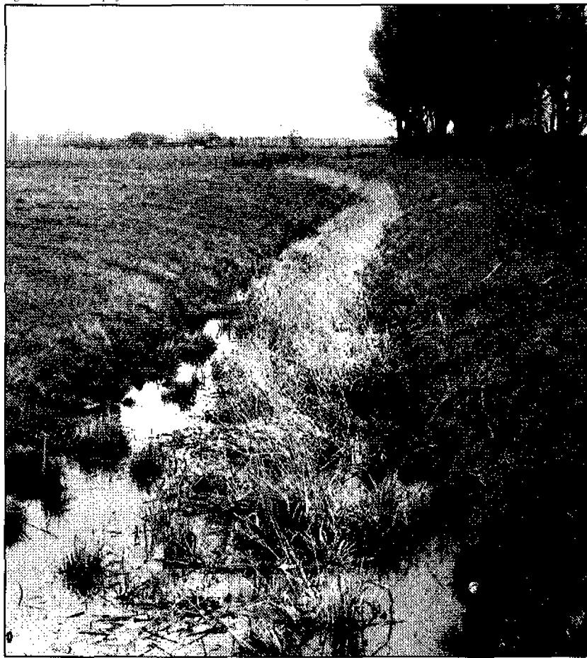
fig 4. Gezicht op de Hunze vanaf het Boterdiep 17). Hier dreigt beplanting in het kader van het project "Hunzebos"

hier de oude bedding geflankeerd door markante oewewallen. Molshopen tonen duidelijk het contrast tussen de zwarte venige verlandde bedding en de grijzige zandige klei van de westelijke oewewal. Deze volgorde: oewewal, bedding met sloot en weg (zie fig 2) is typerend voor de Hunzerestanten. Bij Oude Roodehaan is de Hunze opnieuw goed zichtbaar. Even voorbij het tolhuisje liggen links van de weg mooie oewewallen (3; fig 3). Tot in Euvelgunne, nabij de woon-schepenhaven, blijft de begeleidende weg opvallend bochtig (4). Een deel van deze weg valt in een sluiproute tussen de woonwijk Lewenborg en de stad Groningen. Duizenden Groningers nemen hier dagelijks met grote snelheid de flauwe bochten in de weg, velen on-