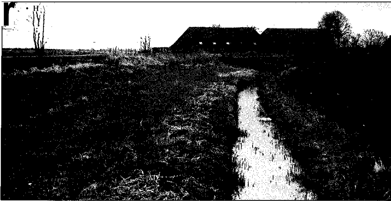
Rg 2. De Hunzebedding ten noorden van boerderij Landzicht (2). De volgorde: neg (links), bedding met sloot (midden) en coeeraol (rechts) is typerend voor de Hunzerestanten

Dit alles behoort tot het verre verleden, want sedert mensenheugenis is de Hunze een bescheiden rivier, gevoed door het overtollig regenwater dat uit de uitgestrekte Drentse hoogvenen stroomde. Eeuwenlang droeg de rivier dit veenwater naar de zee. Niet gehinderd door reliëf koos de rivier een grillige loop vol kronkels en bochten, die men meanders noemt. Bij het ontstaan van de stad Groningen, zo rond het begin der jaartelling, speelde de Hunze vermoedelijk geen opvallende rol. Groningen ontstond waarschijnlijk als een Drents zanddorp op het uiterste noordelijke deel van de Hondsrug, dicht bij de plaats waar het zand onder de klei wegduikt. De Hunze stroomde ruim een ki-