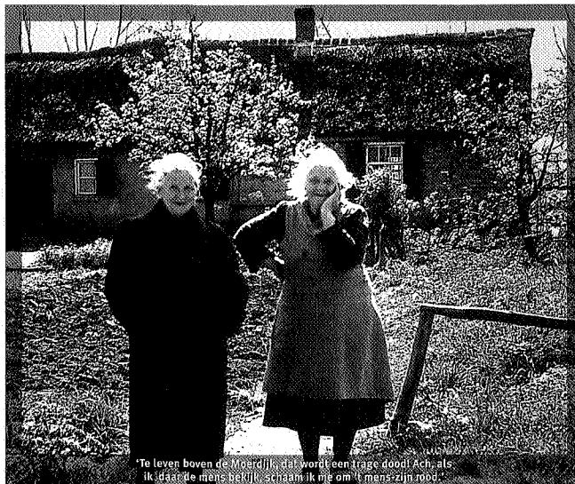
Te leven boven de werkelijkheid wordt een trage doodschijn, als ik daarin de mens betref, schijnt ik nie om 't mens zijn rood.