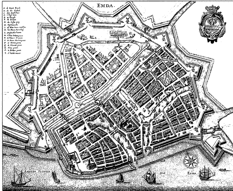
Emden was in de 16e eeuw een toevluchtsoord voor duizenden vluchtelingen

friese buren als de half-gefeodaliseerde Drenten en de Eemsländers koesteren. De beste kansen om zich te ontwikkelen had het echter daar, waar de vrijheid het meest werd bedreigd, in Westerlauwers Friesland. Het machtige Holland, later deel uitmakend van het Bourgondische machtsblok, lag als het ware op gezichtsafstand. Ook als het tijdperk der Friese vrijheid, dat omstreeks 1500 definitief ten einde is, reeds lang historie is geworden werkt dit besef nog door, paradoxaal genoeg juist daar waar de Friese taal verdwenen is, c.q. stervende was. In de tweede helft van de 16e eeuw hanteren de Ommelanden het begrip Fries om hun politiek-ekonomische aspiraties tegenover de aanmatigheden van de stad Groningen kracht bij te zetten, terwijl de republikeinse ('ständische') Emders partij in Oost-Friesland de aloude Friese vrijheid als leitmotiv in de grimmige konfrontatie met de absolutistische landsheren gebruikt. Maar ook de Westerlauwerse Friezen - sinds 1580 tot het kamp van de Neder-